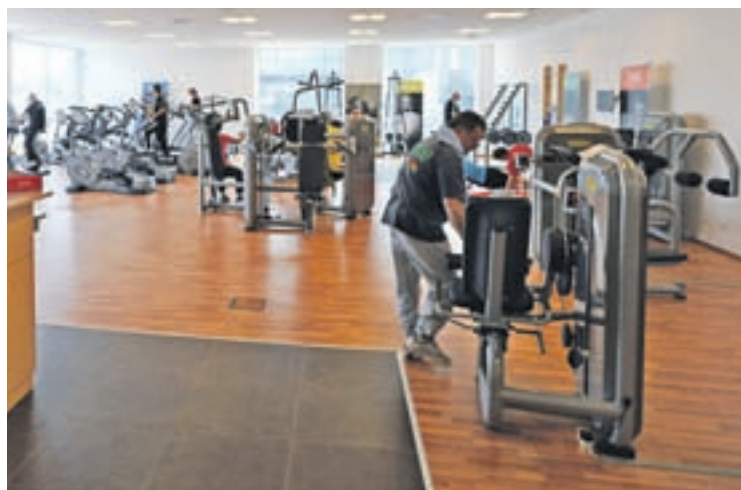
Individuelles Training zur Steigerung Ihrer Gesundheit.

Die medizinische Betreuung, kombiniert mit einem Fitness-Aspekt, ist optimal geeignet, vielen bekannten Krankheitsbildern vorzubeugen. Eine sportmedizinische Untersuchung zu Beginn des Trainings ist die Basis, an der sich das gesamte Trainingsprogramm orientiert. Ines Bauer leitet das mediFIT Thalheim. Das laufende Training wird von ihr und ihren Mitarbeitern stetig kontrolliert und gesteuert. Das mediFIT-Team