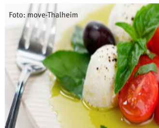
Leckeres in Eigenproduktion.