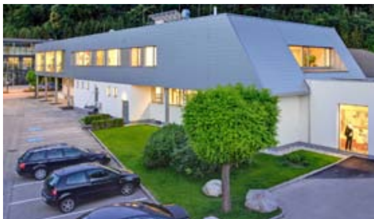
Gesundheits- und Fitnessoase move-Thalheim.

Auch Betriebssporttage organisiert und wickelt move-Thalheim für Betriebe aller Art ab. Die Kombination V e r a n s t a l t u n g s r a u m , Sportcenter, professionelles Personal und eigenes Catering aus einer Hand macht das move-Thalheim einzigartig und ideal für Veranstaltungen im Sport-, Gesundheits- und Ernährungsbereich.